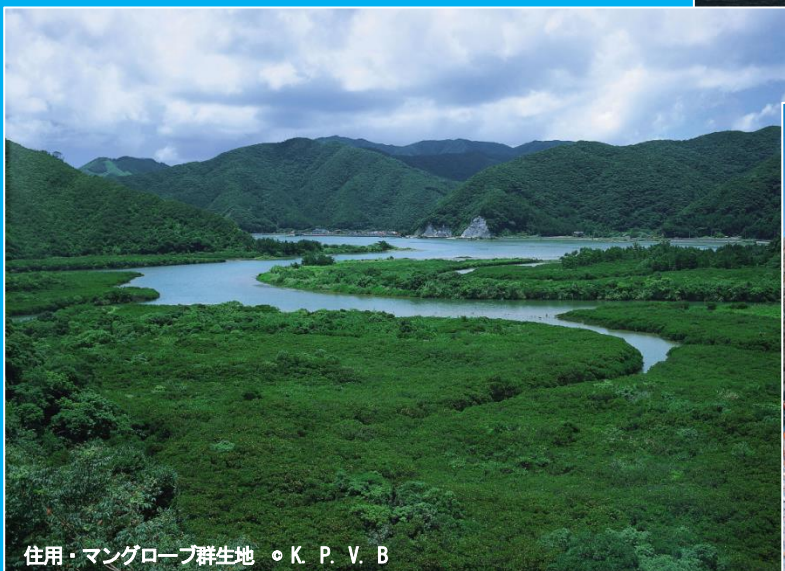
住用・マングローブ群生地 ◦ K. P. V. B