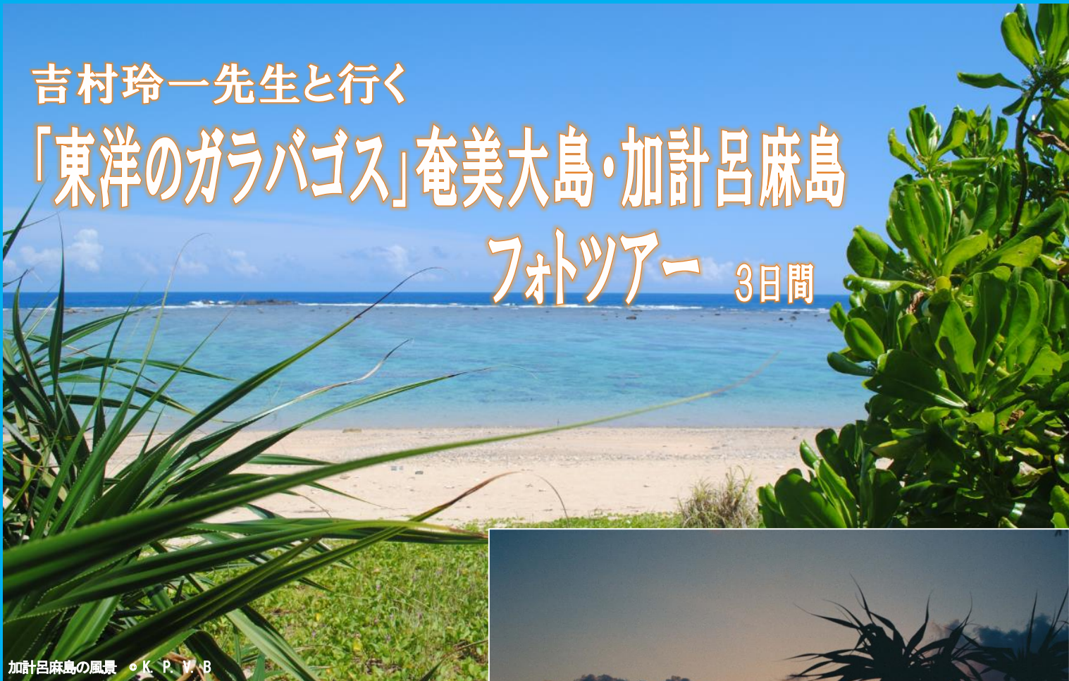
加計呂麻島の風景 ◦ K. P. V. B