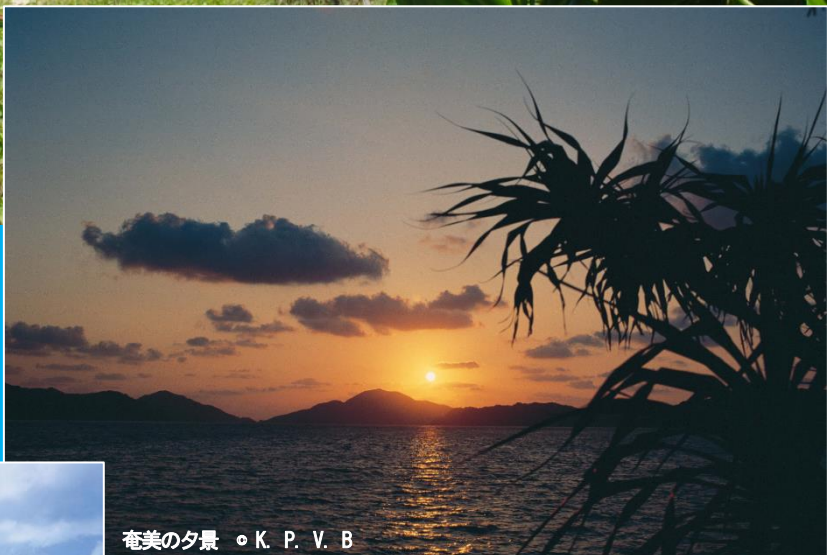
奄美の夕景 ◦ K. P. V. B