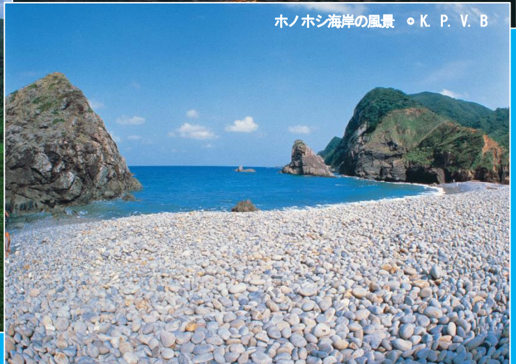
ホノホシ海岸の風景 ◦ K. P. V. B